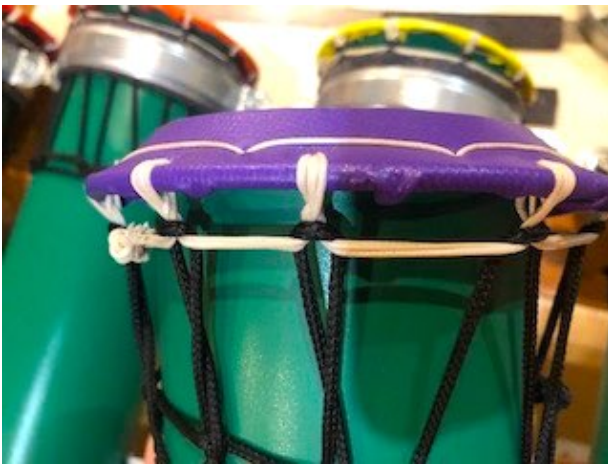
Triple couture des membranes.

Elles sont cousues sur un cercle en métal avec du fil poissé de chaussures de haute montagne, disponible en noir, marron ou blanc. Elles sont ensuite tendues sur les tubes PVC avec du cordage type marine de 3mm utilisé dans l'industrie de la pêche en mer disponible en noir ou blanc.