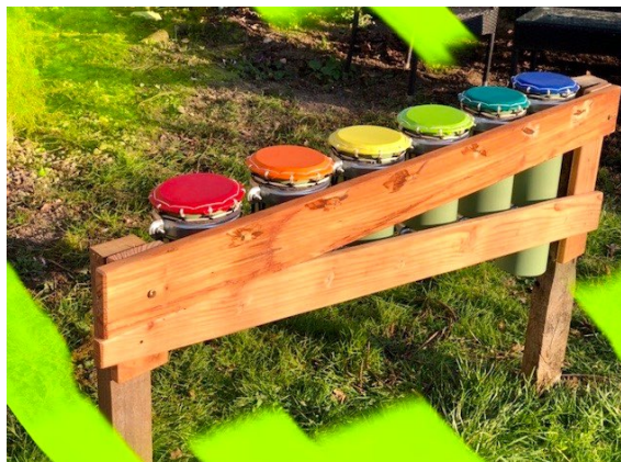
Poteaux plantés dans la terre