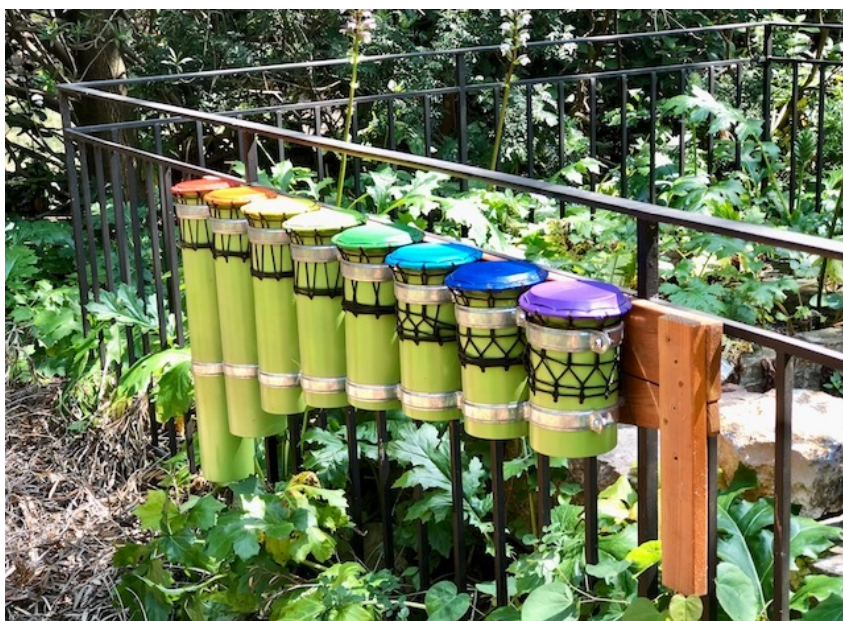
S'adapte aussi à l'environnement existant.