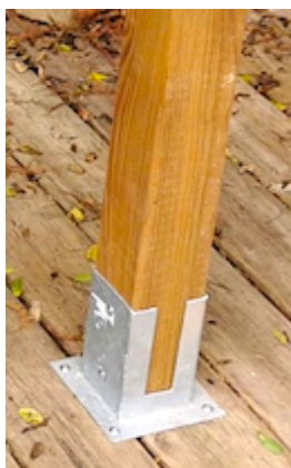
Fixation avec sabot sur terrasse bois ou béton.

Installation simple et rapide : la structure des tambours est vissée sur deux poteaux en bois de charpente traités type chevrons 6X8 (non fournis). En fonction du lieu d'implantation, ces poteaux seront, soit plantés dans la terre, soit fixés avec un sabot en métal (non fournis) sur une terrasse en bois, une dalle en béton,... Chevrons et sabots bons marchés sont disponibles dans la plupart des magasins de bricolage.