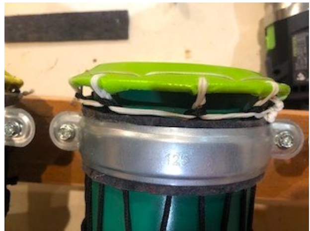
Protection des cordages du collier de fixation avec un feutre synthétique gris foncé.

Les tambours sont en tube PVC de 110 mm neuf de recyclage peint avec deux couches de peinture acrylique de qualité, utilisée par les graffeurs, plus un vernis de protection.